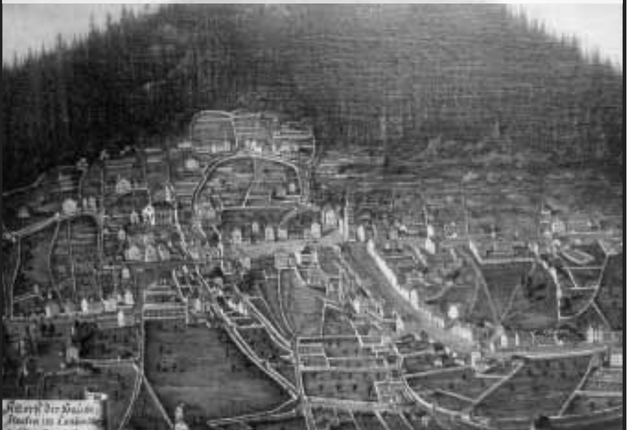
«Altdorff der Hauptflecken im Canton Uri» • 1785 • Carl Aloys Triner (1767–1824) (Das Bild kann im Historischen Museum besichtigt werden)