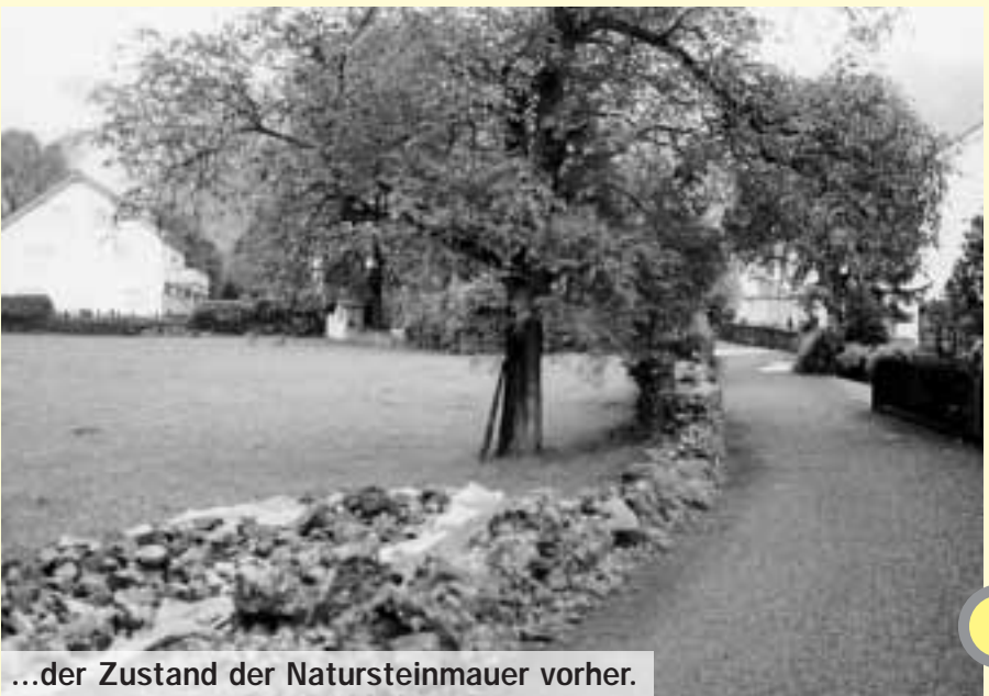
...der Zustand der Natursteinmauer vorher.

In Altdorf gibts Trockenmauern und Mörtelmauern. Erstere sind ohne Mörtel gebaut und sind eher niedrig. Sie entstanden durch das Säubern von Kulturland und dienten zur Grenzsetzung. Die Mörtelmauern sind – wie der Name sagt – mit Mörtel gemauert. Der Mörtel setzt sich je zur Hälfte aus Sand und Grubenkalk zusammen. Die bessere Stabilität erlaubte es, die Mauern bis zu 3 Meter hoch zu bauen. Die Altdorfer Natursteinmauern weisen eine grosse Vielfalt bezüglich Art und Grösse der Natursteine, Fugenbild, Art der Verlegung und Kronenausbildung auf.