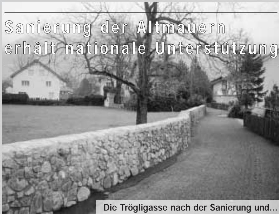
Die Trögligasse nach der Sanierung und...

Altdorf ist geprägt durch das «grüne Erscheinungsbild» der vielen Bäume und Grünflächen einerseits und andererseits durch die vielen Natursteinmauern, die dem Ortsbild einen südländischen Anstrich geben. Insgesamt gibt es in Altdorf rund 10 Kilometer «historische Mauern». Die Natursteinmauern prägen aber nicht nur das Ortsbild, sondern bieten der Fauna und Flora auch einen