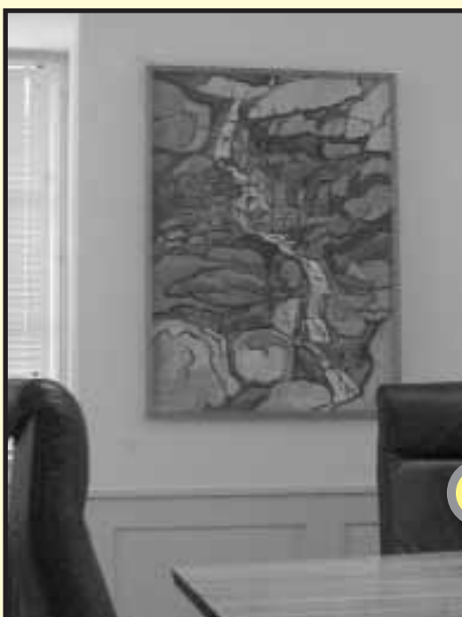
«Bergbach in blauer Landschaft» • 1966 • Karl Iten

Aus Platzgründen ist nur ein Teil der Gemälde aufgehängt, die restlichen sind fachgerecht eingelagert. Damit alle Kunstschaffenden irgendwann zu sehen sind, werden von Zeit zu Zeit die Bilder ausgewechselt. Seit Jah-