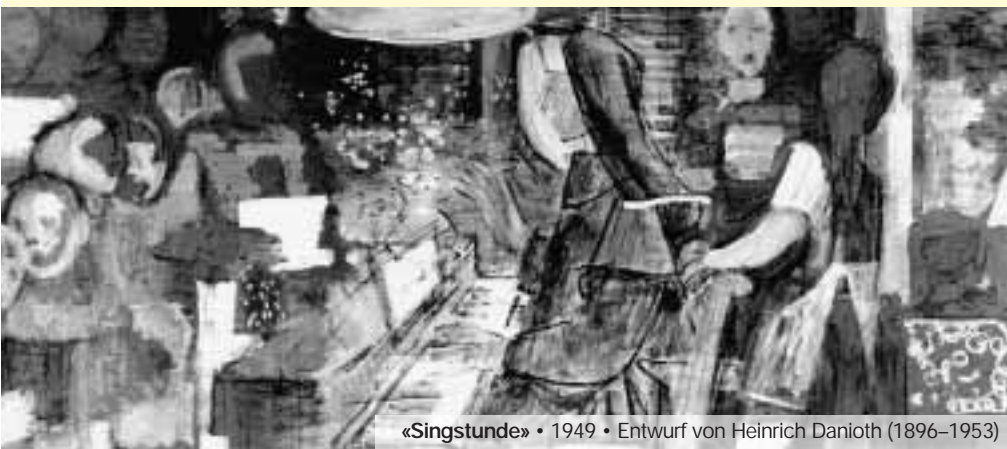
«Singstunde» • 1949 • Entwurf von Heinrich Danioth (1896–1953)