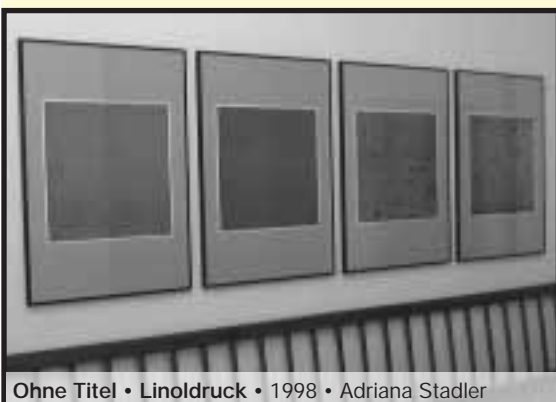
Ohne Titel • Linoldruck • 1998 • Adriana Stadler

ren schon unterstützt und fördert die Gemeinde Altdorf mit dem Kauf von Bildern das Urner und Altdorfer Kunstschaffen. Ein jährlicher Budgetposten ermöglicht es der Gemeinde, die Sammlung zu erweitern, zu vervollständigen oder die Bilder zu restaurieren.