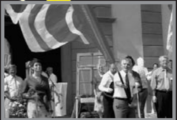
17. Zentralschweizer Gesangsfest in Altdorf