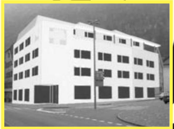
Neues Geschäfts- und Wohnhaus «Krone»