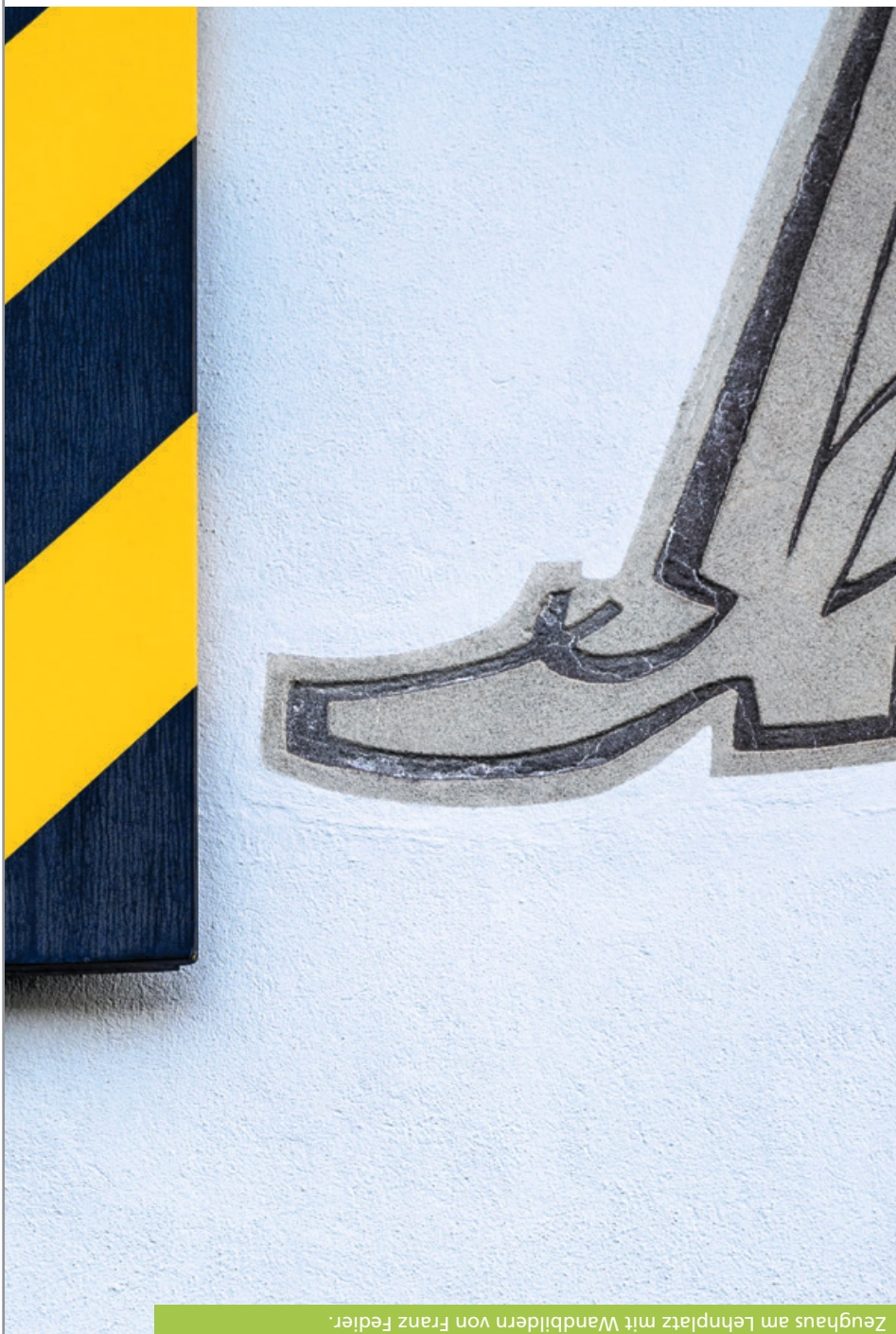
Auflösung dieses Rätsels: Zeughaus am Lehnplatz mit Wandbildern von Franz Fedier.

Ein bestrumpftes Bein mit elegantem Schuh, wo ist das in Altdorf zu entdecken? Sicher ist: Es ist ein symbolträchtiges Wandbild. Wissen Sie sogar, wer es gemalt hat? Zu beachten sind auch die gelb-schwarzen Fensterläden, die auf ein offizielles Gebäude hinweisen.