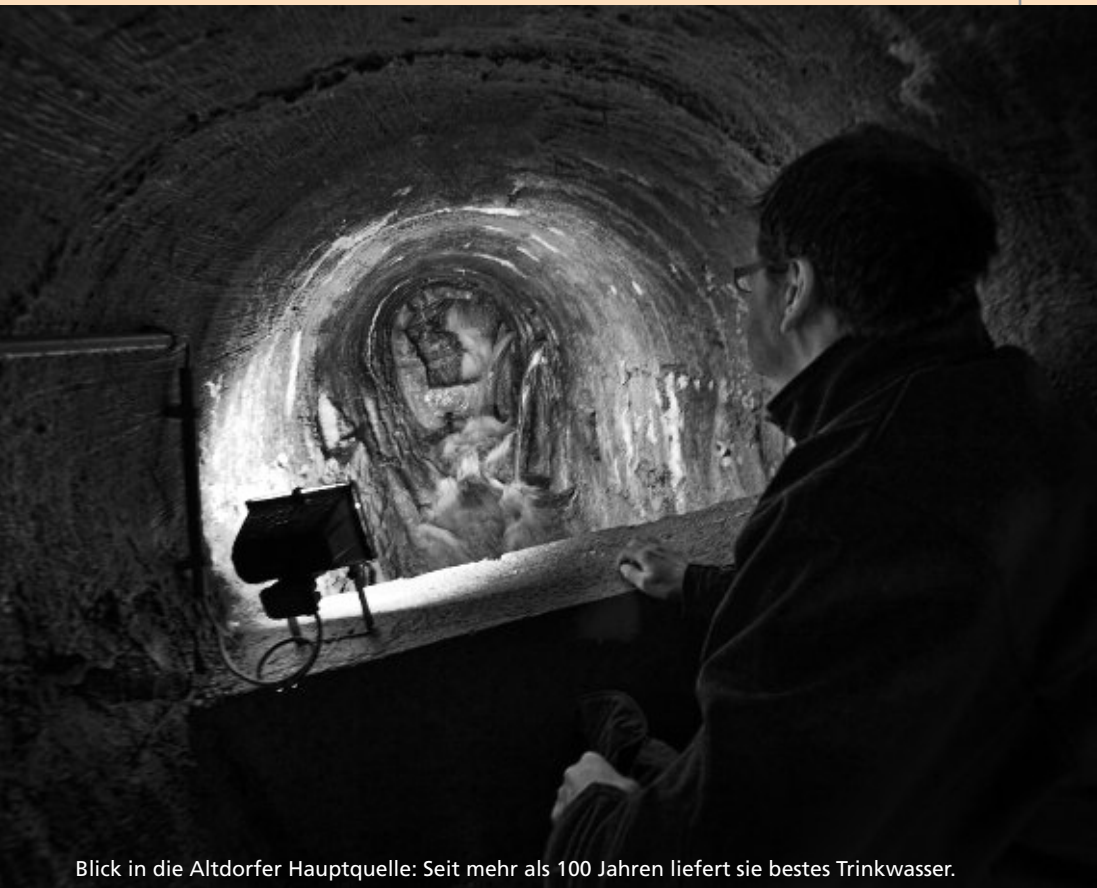
Blick in die Altdorfer Hauptquelle: Seit mehr als 100 Jahren liefert sie bestes Trinkwasser.